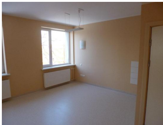
Jaunās telpas veco dzemdību telpu vietā

Lai noskaidrotu klientu viedokli par projekta rezultātu, 2013.gada janvārī notika klientu aptauja. No 100 izdalītajām aptaujām tika saņemtas 25. Aptaujas rezultāti liecina, ka klienti par projekta ieviešanu bija informēti un projekta rezultātus novērtē atzinīgi.